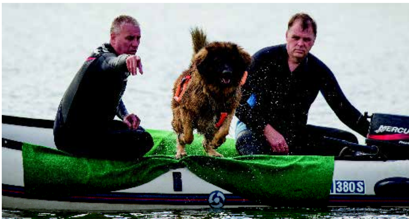
'Nationale Brevetten Waterwerk'. De honden gaan te water en leggen verschillende proeven af.

en alle in (ras)honden geïnteresseerden belangrijk. Dat wordt bevestigd door het besluit dat de nieuwsbrief Raadar weer iedere maand gaat verschijnen en aan duizenden abonnees (gratis) wordt verzonden. In het kynologisch maandblad ONZE HOND wordt iedere maand, in de rubriek Raadar XL , een artikel gepubliceerd over onderwerpen en zaken waar de Raad van Beheer mee bezig is.