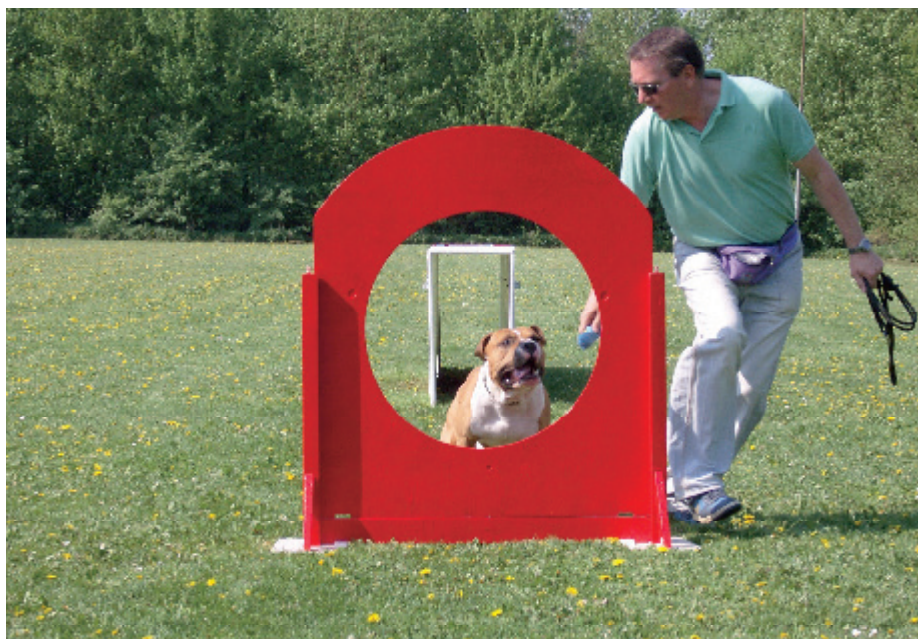
Sporten met de hond, hier in 'Funny O'.

'Al vrij jong kwam ik in het bestuur van een grote watersportvereniging.