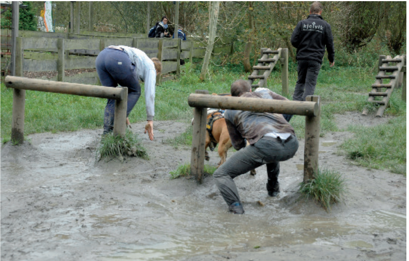
Dogsurvival bij de ASTCH.

‘Nederland is een hondenminnend land. De hond is meestal een gezinslid, goed verzorgd en gerespecteerd, iets dat in andere landen nog niet zo vanzelfsprekend is. De