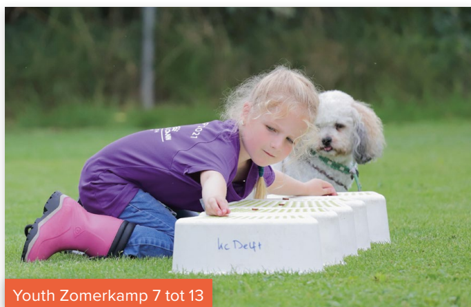
Youth Zomerkamp 7 tot 13

Wil je nog eens zien hoe een zomerkamp eruitziet, bekijk dan de video-impressie en lees de Raadar Special van vorig jaar nog eens terug.