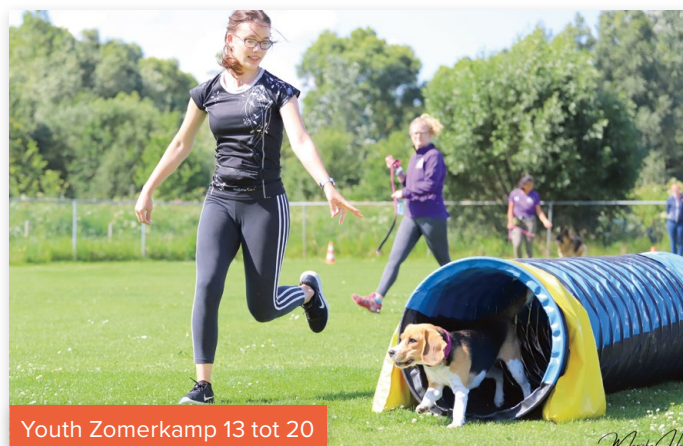
Youth Zomerkamp 13 tot 20