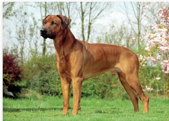
De Rhodesian Ridgeback steeg naar de 3e plaats

Uiteraard werden er veel meer dan 40.000 pups geboren en geplaatst in 2021. Hoeveel dat er zijn is niet bekend, omdat wij geen zicht hebben op honden zonder stamboom. Bij de stamboomhonden is de Rhodesian Ridgeback nieuw in de top-3 (stond op plek 5). Dit ras is daarmee de Duitse Herder en de Berner Sennenhond in populariteit voorbijgegaan.