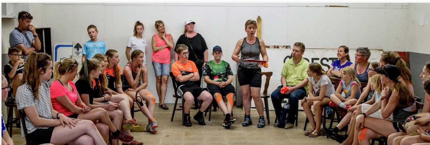
De junior deelnemers luisteren geconcentreerd naar een briefing van de coaches...