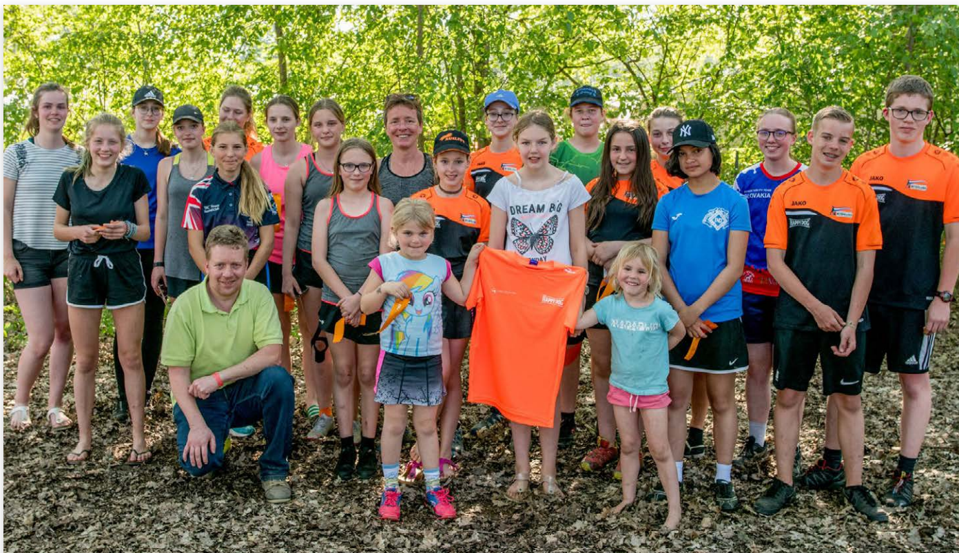
De kersverse selectie voor het European Open Agility Junior