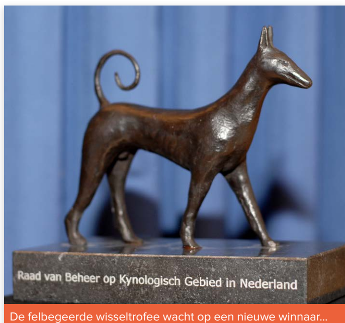
De felbegeerde wisseltrofee wacht op een nieuwe winnaar...

Voor verdere informatie en actuele gegevens rondom De Nationale gaat u naar www.nhsn.nl of stuur een e-mail naar info@nhsn.nl . Tot 29 juni!