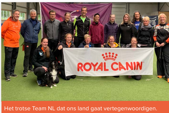
Het trotse Team NL dat ons land gaat vertegenwoordigen.

Op 5 en 6 mei jl. vond de laatste selectie plaats voor het FCI Wereldkampioenschap Agility in Turku, Finland, van 19 tot 22 september aanstaande. Er werd tot op het laatst volop gestreden, niets was zoals het leek en de kaarten zijn flink geschud. De selectiewedstrijden worden ondersteund door Royal Canin, onze partner in sport.