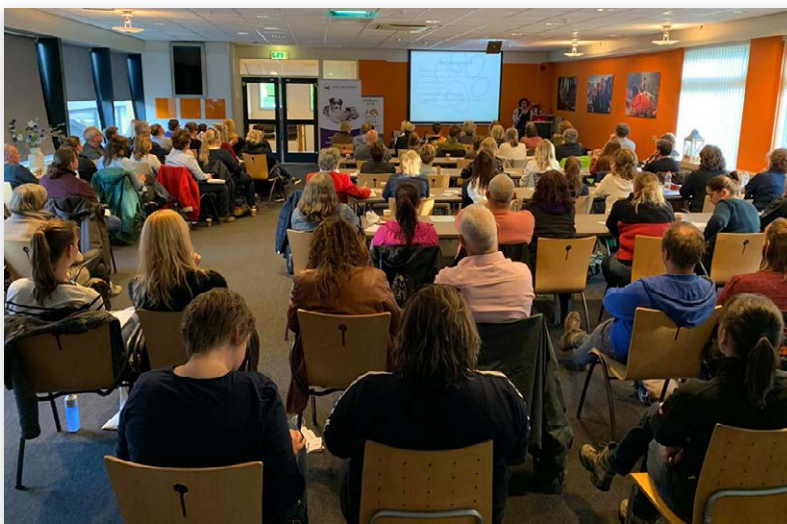
Ook deze Kennis Tour-sessie was weer helemaal uitverkocht...

voor(oor)delen van graanvrije voeding en andere fabels en feiten. Weet jij hoe het werkelijk zit?' Het internet staat vol met statements en adviezen van 'experts' die hun mening verkondigen over de enig juiste manier van voeren van de hond. Graanvrije voeding voor onze hond wordt hierbij veelvuldig aangehaald. Maar wat is nou de zin en de onzin van graanvrij voeren? Is graan nou echt zo slecht voor het dier? De bron van allergieën en onverklaarde ziektecondities? Zijn er ook risico's en nadelen verbonden aan graanvrij voeren?