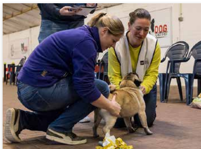
Het hele hondje moet goed worden bekeken...