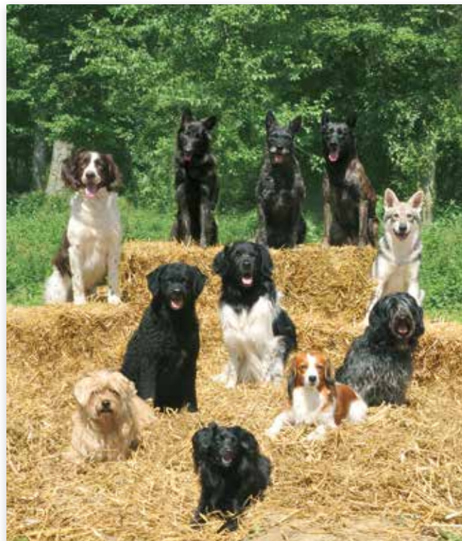
De Nederlandse Hondenrassen gebroederlijk bij elkaar...

Elk land heeft zijn nationale hondenrassen. Zo ook Nederland. Het gaat om rassen met vaak een lange geschiedenis in jacht, drijven, hoeden of als gezelschapshond. Hondenrassen waar we trots op mogen zijn en die alle aandacht verdienen. Nederland heeft negen Nationale hondenrassen die erkend zijn door de Raad van Beheer: Drentsche Patrijshond, Schapendoes, Hollandse Herder, Saarlooswolfhond, Hollandse Smoushond, Stabijhoun, Markiesje, Wetterhoun en Nederlandse Kooikerhondje.