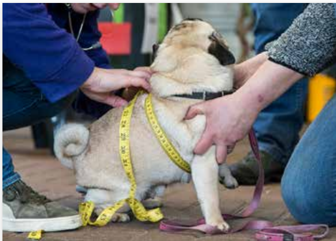
Werkelijk alles moet worden gemeten...