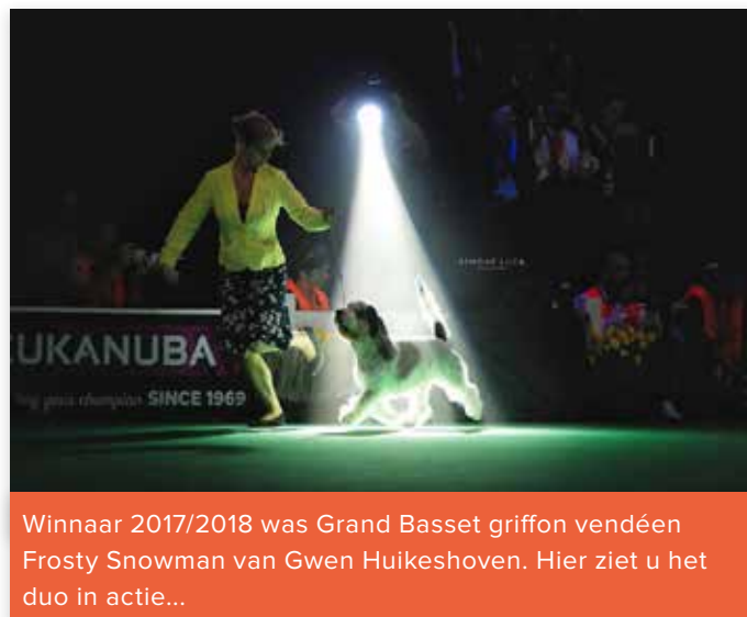
Winnaar 2017/2018 was Grand Basset griffon vendéen Frosty Snowman van Gwen Huikeshoven. Hier ziet u het duo in actie...

Als er geen Nederlandse hond 'Best in Show' en ook geen Nederlandse hond 'Reserve Best in Show' wordt, maar er is wel een Nederlandse derde plaats (3e BIS) aangewezen, dan krijgt deze hond 10 punten. Is er geen 3e plaats aangewezen, dan vervallen deze punten.