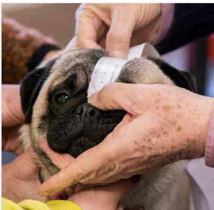
...waaronder de schedel...