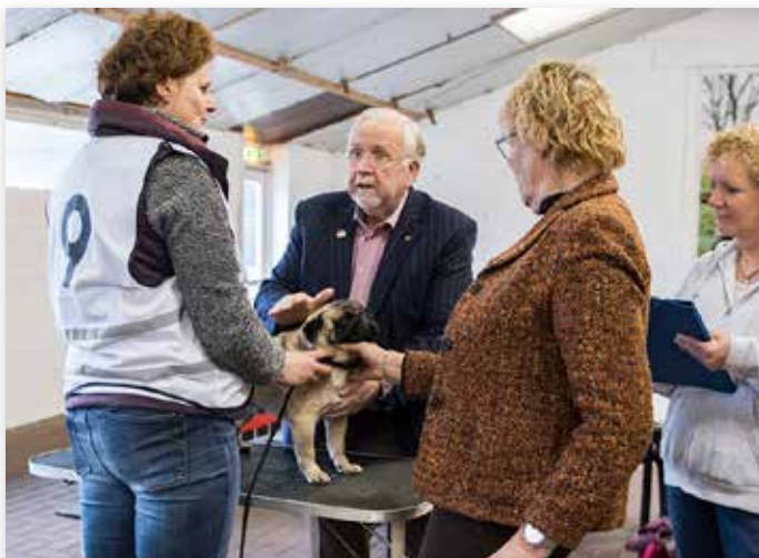
Bij de keurmeester op de tafel voor een zorgvuldige check

De Mopshond heeft een uniek en mooi karakter, maar ook uiterlijke kenmerken die kunnen leiden tot gezondheidsproblemen. Vooral de vorm van de neus en schedel kan tot problemen leiden. Er wordt dan ook hard aan gewerkt om problemen binnen het ras terug te dringen. In dit kader organiseerde de Raad van Beheer samen met rasvereniging Commedia op 10 februari in het Dogcenter te Kerkwijk een schouwdag om de stand van het ras te beoordelen. Maar liefst vijftig honden tussen de 1 en 3 jaar werden gekeurd.