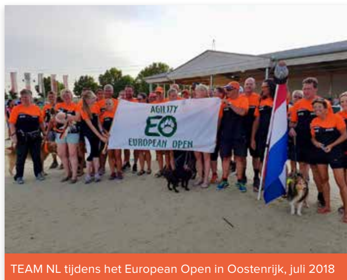
TEAM NL tijdens het European Open in Oostenrijk, juli 2018

Voor zo'n geweldig mooi evenement zijn natuurlijk ook enorm veel vrijwilligers nodig. Als vrijwilliger heb je allerlei taken in een wedstrijdtring, maar zit je meteen ook