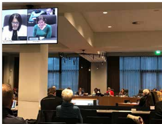
Raadsvergadering over evenementen met dieren in Amsterdam

Wel kan de gemeente de NVWA inseinen als zij zorgen heeft over het dierenwelzijn tijdens een bepaald evenement. Het CDA en de Partij van de Ouderen vinden het onnodige administratieve regelgeving. Zij vinden dat je beter uit kunt gaan van vertrouwen en dat mensen die met dieren werken daar ook goed voor zorgen.