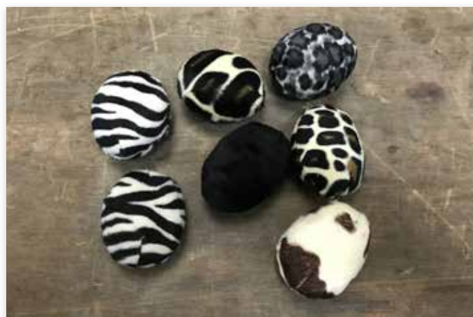
Commedia had voor alle deelnemers een speeltje voor de hond als dank