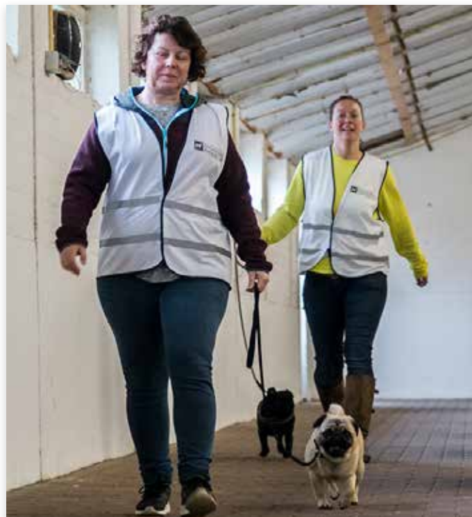
Een kilometer lopen in een flink tempo was een van de onderdelen...