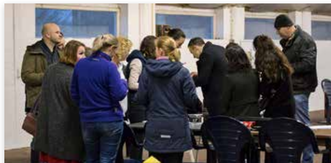
Er was een prima opkomst van deelnemers...

Aansluitend werden de dieren door gespecialiseerde keurmeesters beoordeeld op een aantal kenmerken die van belang zijn voor de gezondheid: lengte van de neus en van het hoofd, staan de neusgaten mooi open of zijn ze ►