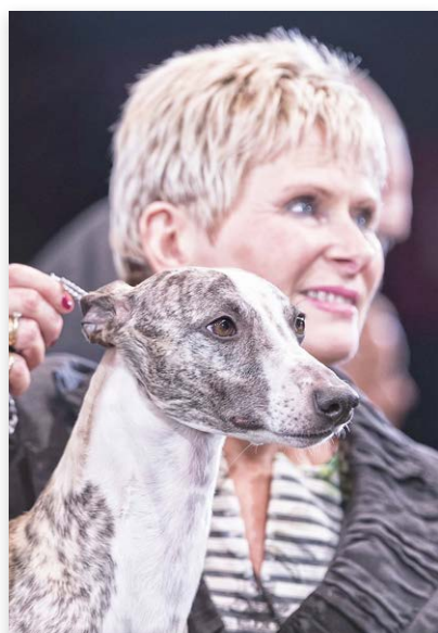
Winnaar Tease de Whippet met zijn baasje

De Crufts-show was weer een heerlijk spektakel om naar te kijken en om te genieten van de prachtigste honden