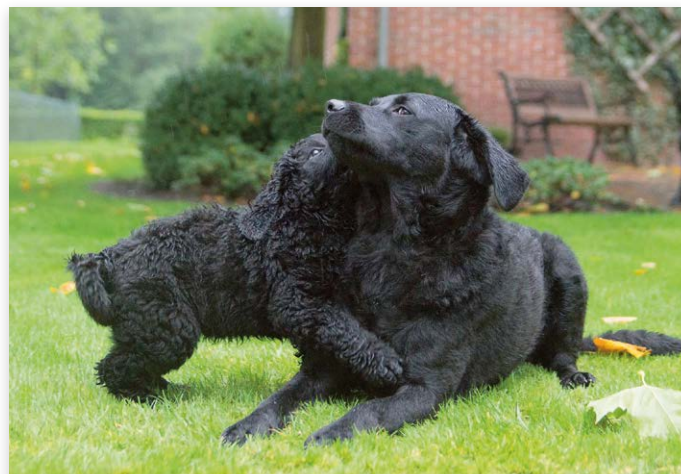
Een pup uit de tweede generatie met zijn moeder afkomstig uit de eerste generatie outcross

We realiseren ons dat we nog maar net begonnen zijn en dat we tot 2028 nog een lange weg te gaan hebben. Maar onze fokkers betrekken we er goed bij en tot nu toe halen we onze doelstellingen. Voor 2018 is er een