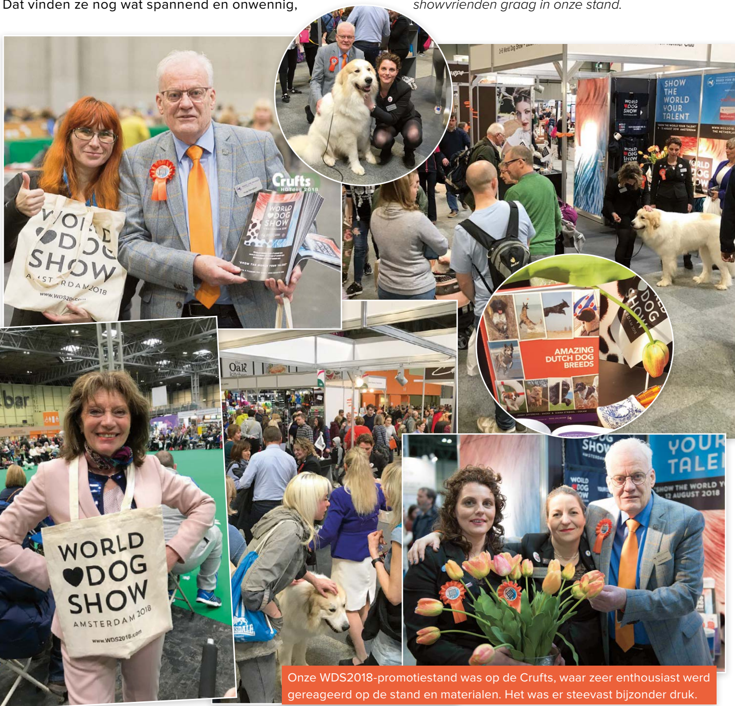
Onze WDS2018-promotiestand was op de Crufts, waar zeer enthousiast werd gereageerd op de stand en materialen. Het was er stevast bijzonder druk.

De WDS2018-stand zal ook nog aanwezig zijn tijdens de Eurasia 2018 in Moskou en de Europasiëger Show in Dortmund. We verwelkomen u en uw (buitenlandse) showvrienden graag in onze stand.