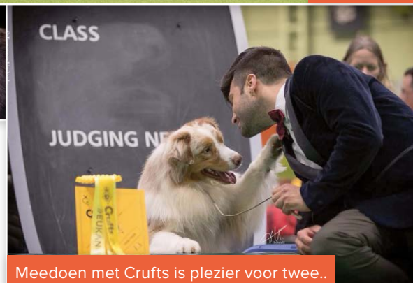
Meedoen met Crufts is plezier voor twee..