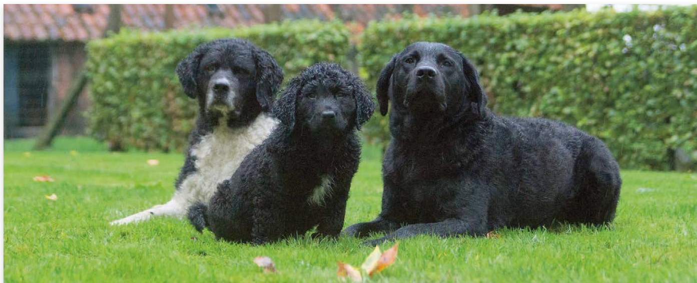
Van links naar rechts een raszuivere Wetterhoun, een pup uit een combinatie van een raszuivere Wetterhoun en een teef uit een eerdere outcross (F2), en een outcrosshond geboren uit de combinatie raszuivere Wetterhoun en Labrador

Wij besteden veel aandacht aan publiciteit voor de unieke pups die geboren zijn. Zo is het steeds gelukt om voor alle pups een goede baas te vinden. Nieuwe eigenaren moeten ons fokprogramma onderschrijven en eraan mee willen werken door ermee te gaan fokken indien hun hond geselecteerd is. We werken met een ►