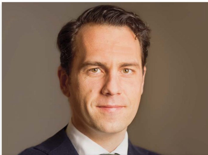
Staatssecretaris Van Dam wil meer inzetten op voorlichting

Op 1 februari gaf staatssecretaris Martijn van Dam van Economische Zaken antwoord op vragen van Kamerlid Frank Wassenberg (PvdD) over de kritiek van de Vlaamse minister Ben Weyts op de Nederlandse aanpak van de malafide puppyhandel. Van Dam laat weten dat hij de noodzaak van internationale samenwerking onderstreept. Hij gelooft niet in uitbreiding van de NVWA, maar wil onder andere inzetten op meer voorlichting.