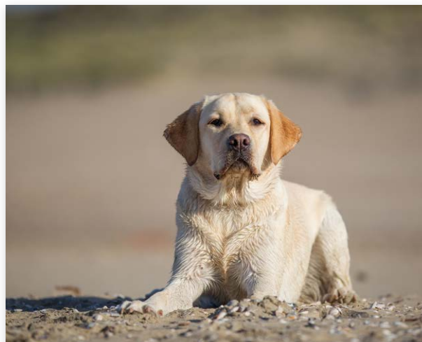
Juiste antwoord juli: Labrador retriever