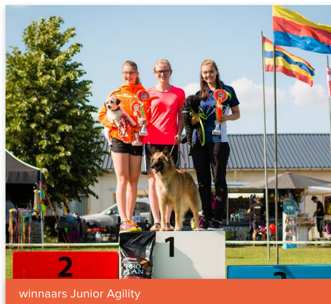
winnaars Junior Agility