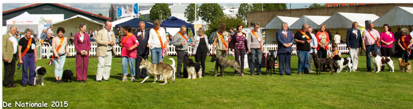
De Nationale 2015