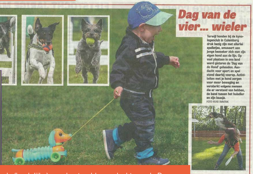
Ook de (landelijke) pers besteedde aandacht aan de Dag van de Hond, onder andere de Telegraaf.