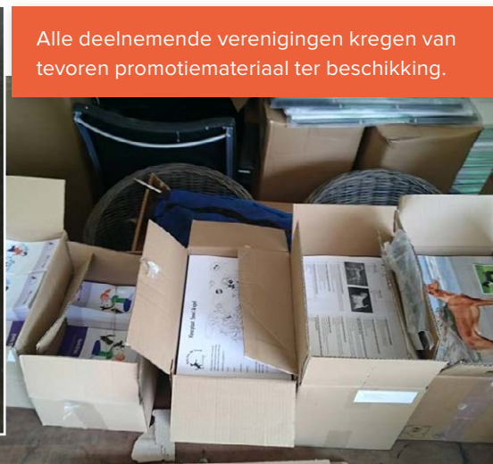
Alle deelnemende verenigingen kregen van tevoren promotiemateriaal ter beschikking.