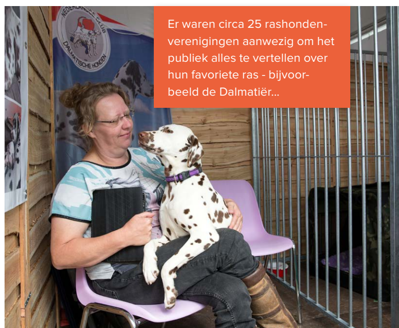
Er waren circa 25 rashondenverenigingen aanwezig om het publiek alles te vertellen over hun favoriete ras - bijvoorbeeld de Dalmatiër...