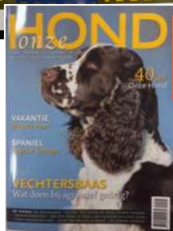
Aandacht in onder andere Onze Hond en Tsjakka!