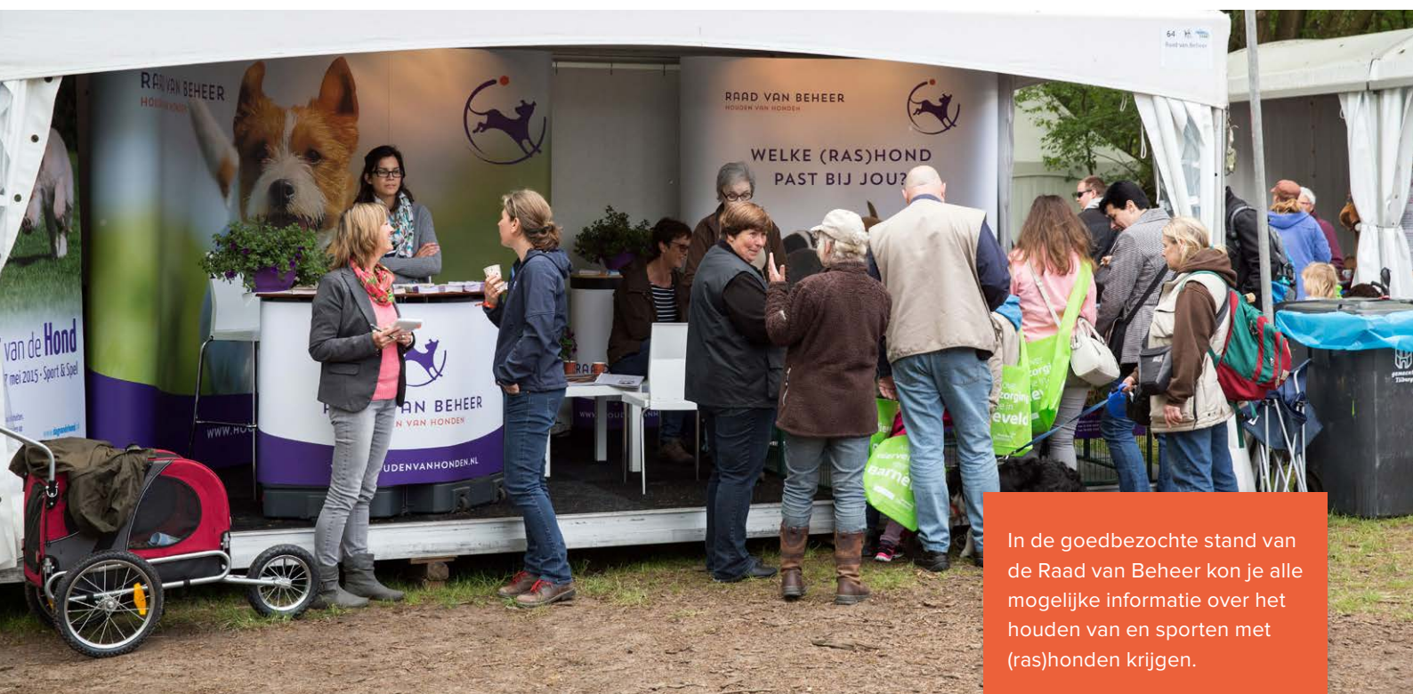
In de goedbezochte stand van de Raad van Beheer kon je alle mogelijke informatie over het houden van en sporten met (ras)honden krijgen.

De Flyballsport is dit jaar weer goed gepromoot op het Animal Event. Iedere dag werden er met veel passie workshops en demonstraties gegeven. Veel bezoekers werden enthousiast voor deze sport en al hun vragen konden worden beantwoord. Voor het eerst was er op 8 mei de wedstrijd 'Snelste Flyball Hond van Nederland'. Een bescheiden deelnemersveld streed in vier verschillende klassen om de begeerde titels. En snel dat ze waren! In de hoogste klasse (A) liep de snelste hond in de finale een tijd van slechts 4,93 seconden... Veel foto's en filmpjes van Flyball zijn te vinden op een speciale website . Daar staat ook een live radioverslag van de finale in klasse B via Omroep Brabant.