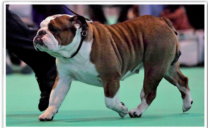
Rasverenigingen Engelse Bulldog slaan handen ineen.