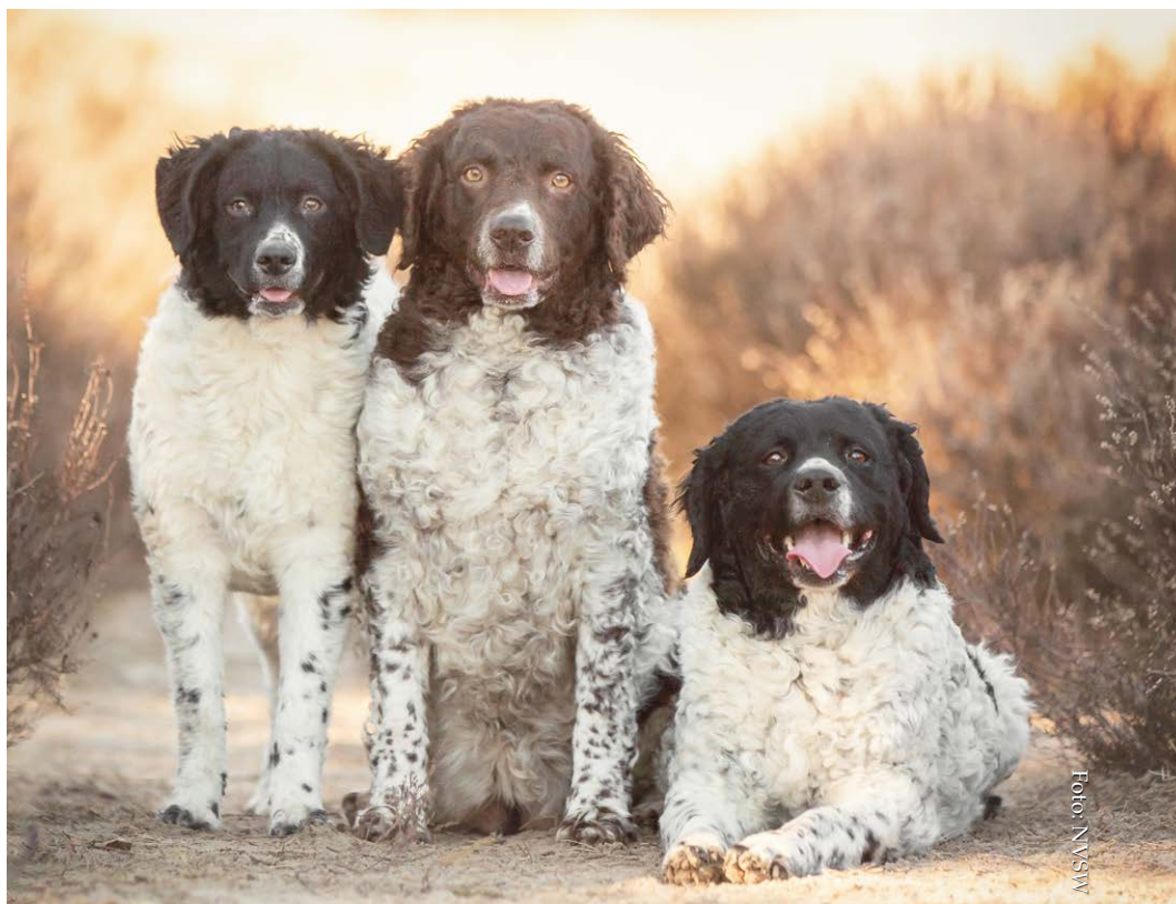
De NVSW doet er alles aan om de Wetterhounpopulatie gezond te houden.

'Om de kwaliteit van het ras hoog te houden, zorgen wij voor fokbeleid en -advisering, geven dekadviezen, organiseren fokgeschiktheidskeuringen, monitoren de fokresultaten, registreren alle mogelijke informatie zoals ziektes en erfelijke afwijkingen in onze ZooEasy-database. Maar we organiseren ook fokkersdagen, -beraden en -cursussen, voeren een pupinformatiedienst, werven nieuwe fokkers en dekreuen, onderhouden contacten met deskundigen en wetenschappers. Het is veel, maar gelukkig doen we dit met veel mensen samen. Voor het gezond houden van het ras is met name onze uitgebreide database zeer waardevol. Hij bevat belangrijke informatie waar onderzoekers veel aan hebben.'